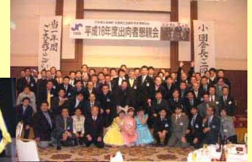
当一年間 平成16年度出向者懇親会 小田金澤支部