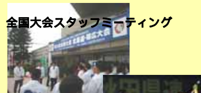
全国大会スタッフミーティング