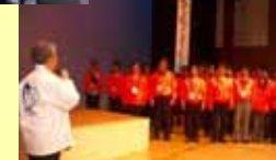
本当にお疲れ様でした