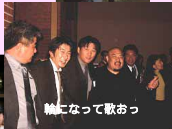
輪になって歌おっ