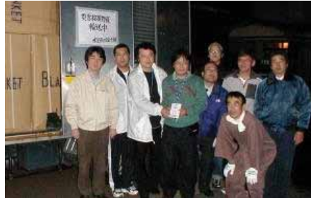
多くのYEGメンバーが駆けつけてくれました