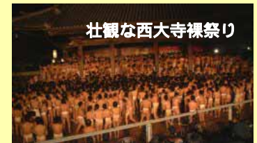
壮観な西大寺裸祭り