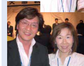
大スクープ!! 四国大会に ヨン様現わる?!