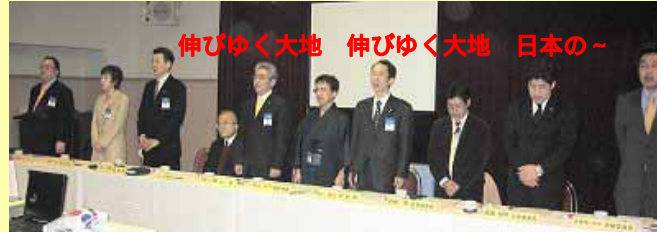
伸びゆく大地 伸びゆく大地 日本の～