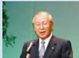
日本商工会議所 会頭 山口 信夫