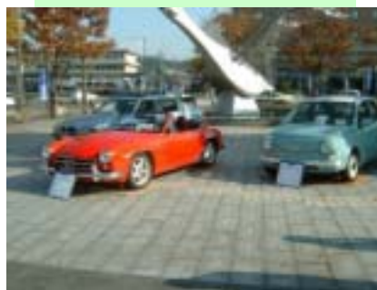
(株)車輪庫 今年も契約できたとか？