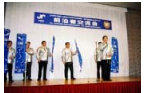
第21回全国会長研修会 ふくい会議のPRが元気いっぱいに繰り広げられる