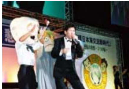
足立実行委員長 この歌は本当にこれで最後です(?)