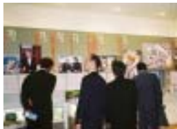
妖怪について、かなり 詳しくなったかも

2003年3月にOPENの記念館。ゲゲの鬼太郎というブランドを生み出した水木しげる氏の哲学・創造力や、世界各地から集められた妖怪に関する珍しい品々には、参加者の発想が好転する鍵が隠されています。