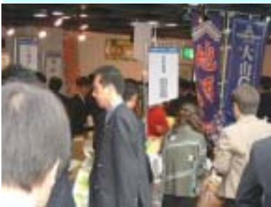
米子ええもん会 地元の物産に興味津々