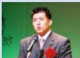
参議院議員 田村 耕太郎