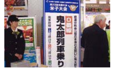
3班に分かれて JR 米子駅「0 番線」ホームから境港分科会会場へ