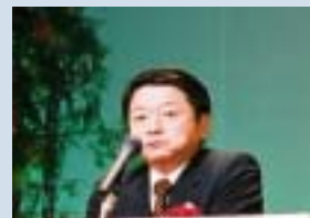
鳥取県知事 片山 善博