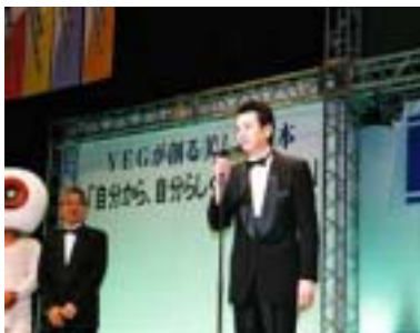
感動で少々緊張ぎみの荒濱大会会長