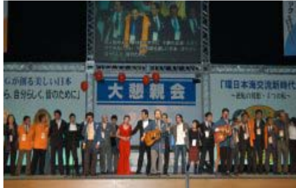
最後は小田原バンドと会場が一体となり、 友情を深めた

全国から来られた YEG 会員の皆様に、 鳥取県の良さを ここならではの食 と ここならではのおもてなし を通して、 「また来てみたい」と思って頂ける 満足ある懇親会を目指しました。