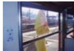
ねずみ男がお出迎え

全長わずか 17.9km、単線。自動車社会の昨今は存在感の薄い路線であった。しかし、車体に鬼太郎のペイントをした事で、話題の路線へ好転した。鬼太郎列車に乗車した瞬間から物語は始まります。