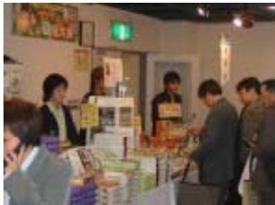
妖怪舎 さすが鬼太郎グッズ、 爆発的な売れ行き