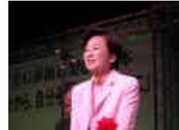
女優の司葉子さん も駆けつけて下さ いました。