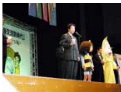
古泉相談役による、乾杯