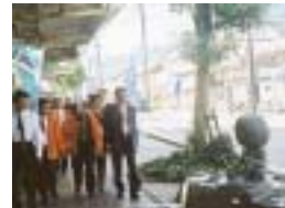
歩道のあちらこちらで 妖怪たちと目が合う

駅を降りると、妖怪達の町です。駅前商店街が妖怪の登場で転生、生まれ変わりました。800mの通りに83体の妖怪達がずらりと並び、少し寂れた風景も妖怪と不思議なハーモニーで活かされています。