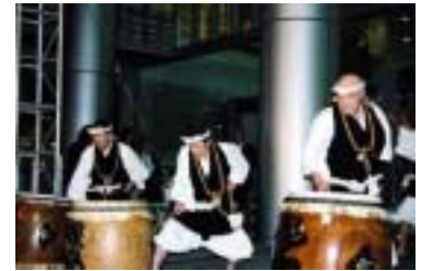
迫力ある僧兵太鼓で歓迎