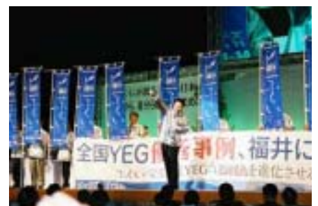
第21回全国会長研修会ふくい会議 PR