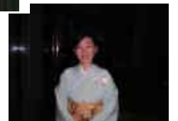
会場で見かけた 着物美人