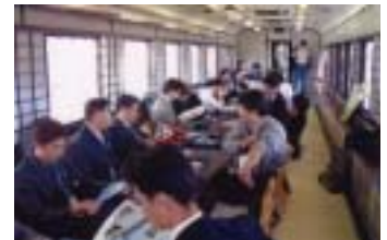
貸切り列車にはお座敷タイプも