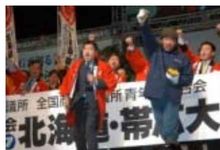
北の国から熱き思いを運んでくれました。