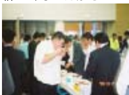
大盛況だったカニの食い放題。

海沿いにそびえ立つタワーでの自由行動。世界最大規模の立体映像システムで環日本海交流時代の勉強をするもよし、温泉から海を展望するもよし。