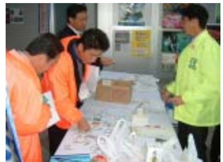
ビジネス交流プラザ景品交換 鬼太郎ファミリーのピンズが意外と大人気