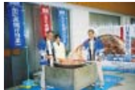
「皆よく食べてくれたなあ」 カニの試食会にて

日本海時代を展望した対岸貿易の海の玄関口として、国際的な水産・貿易都市として注目を集めている境港市。国際都市へ期待が集まる一方、ノスタルジックな街づくりで全国から多くの観光客を集めています。マイナスのイメージの強い「妖怪」を前面に出す逆転の発想により、寂れた商店街に活気が戻り、全国から新しい顧客を集めるようになりました。参加者には、実際に官民一体となった観光ルートを回っていただき、発想の転換から新しい価値を見出す商品づくりを学んでいただくと同時に、妖怪との出会いで心を癒し、楽しく交流していただきました。