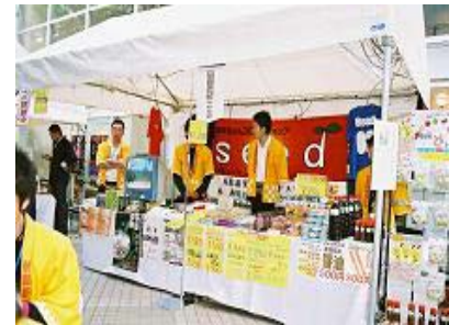
鳥取商業 高校生が運営する楽しいお店