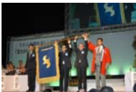
大会旗は帯広 YEG の手に