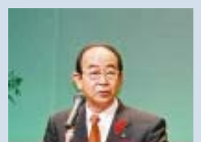
米子市長 野坂 康夫