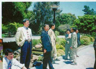
会長もホッと一息