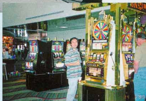
ラスベガス空港もカジノだらけ...写真は私です