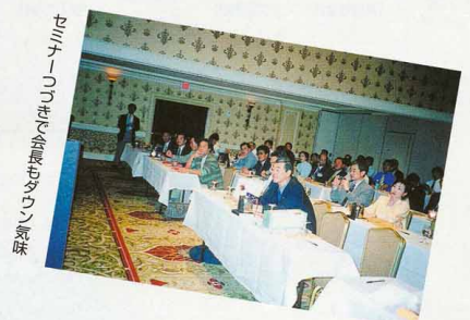
セミナーのとき会場がテンション気味