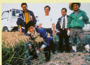
農業から、多くの事を学びました。