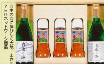
YEGネットワーク商品 自由の海に伸びゆく大地、まさにYEGネットワーク商品