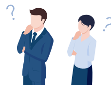
担当：政策提言委員会

政策提言委員会ベテランメンバーによる『各単会のお悩み相談ブース』を開設します。「政策提言をしたいけれど進め方が分からない！行政や親会をもっと巻き込みたい！政策提言をしているけれど、どう検証したらいいか分からない！」そんなお悩みを解決しましょう。政策提言のスタートアップから中級編・上級編まで、経験者が全国各単会のお役に立てるようお応えします。