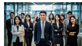
担当：ビジネス活性化委員会

全国の YEG 会員へのアンケート・ヒアリング結果・課題や成功事例をデジタルブックにまとめました。身近な現状や仲間からの声をぜひご覧ください。