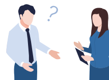
担当：組織活性化委員会

組織活性化委員会の活動を通して得た全国の課題や問題に対しての情報をもとに、現実的かつ効果的なアイデアを共有できる場を提供します。単会の活性化を図り、ひいては新たなビジネスにつながるチャンスの創出を目的とする場となっております。