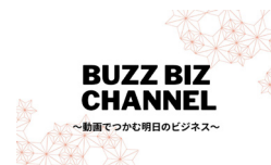
担当：ビジネス活性化委員会

全国のメンバーからお寄せいただいた「事業 PR ショート動画集」と現地出展者のブースを生中継でオンライン会場 (EventBASE) と会場内休憩エリアで動画配信！