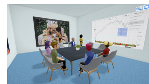
担当：第43回全国大会加賀能登の園いしかわ小松大会実行委員会

第43回全国大会加賀能登の園いしかわ小松大会メタバス大会のPR、および多くの方にメタバス会場の概要と操作方法をブースでデモ体験を交えて紹介します。※EXPO 登録者は、2/3～24の期間中メタバス会場を利用できます！