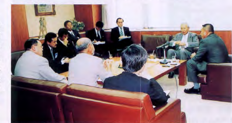
YEGスピリッツから、社会・経済・教育、日本人の失くした ものまで大いに語り合った (7月25日 日本商工会議所にて)