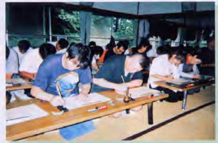
写経に取り組む参加者

最後に一生に一度の体験として、みなさんの単会・企業の研修に一度はご利用してみてください。一度体験すると世界が変わるかもしれませんよ。 合掌