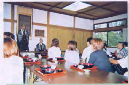
一汁三菜の食事をいただく