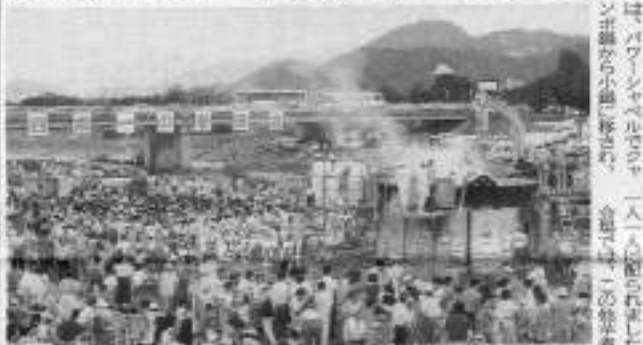
山形青年部イベント

山形青年部が平成元年より主催し、立案、そして実施してきた「日本一の芋煮会フェスティバル」は、今年で三回目を迎えることになった。秋の祭りの伝統、芋煮会を核として実施された「日本一の芋煮会フェスティバル」は、切り口を変えて、今年も新しいイベントとして企画された。会場は山形県山形市山形公園にあり、山形県内外から約二十万人が、九月一日(日)の朝から夕方まで、この大規模なイベントに参加した。山形青年部は、このイベントを通じて、山形県内外の交流を促進し、豊かな郷土を創ることに貢献したいと考えている。