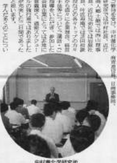
中村商化学研究所