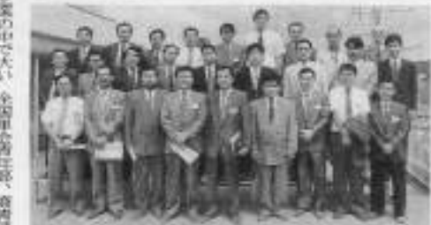
商育連企業視察セミナー参加者