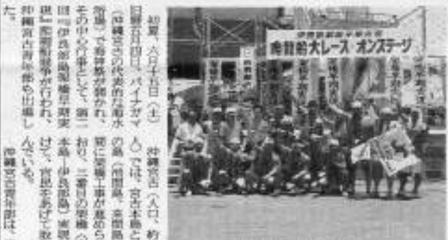
沖縄宮古青年部イベント

沖縄宮古青年部は、このイベントを通じて、沖縄県内外の交流を促進し、豊かな郷土を創ることに貢献したいと考えている。今年も、沖縄県内外から約二十万人が参加した。沖縄宮古青年部は、このイベントを通じて、沖縄県内外の交流を促進し、豊かな郷土を創ることに貢献したいと考えている。