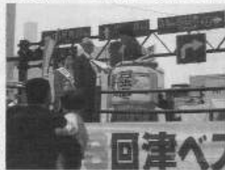
津青年部イベント

昭和六十一年六月に設立した「津青年部」は、今年で三十周年を迎える。この間、津の発展に貢献し、豊かな郷土を創ることに貢献してきた。今年も、津の発展に貢献し、豊かな郷土を創ることに貢献したいと考えている。