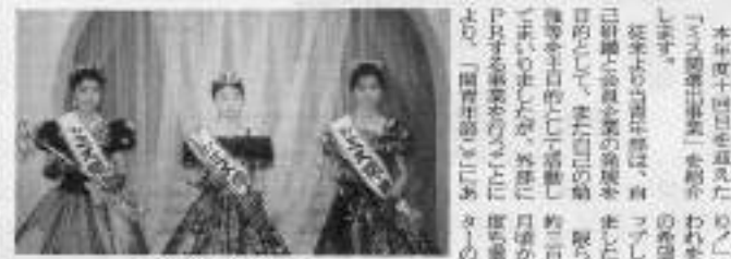
関青年部イベント

関青年部は、このイベントを通じて、関の発展に貢献し、豊かな郷土を創ることに貢献したいと考えている。今年も、関の発展に貢献し、豊かな郷土を創ることに貢献したいと考えている。