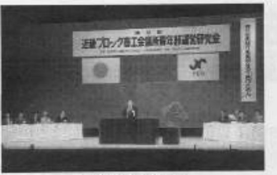
近畿ブロック運営研究会

「現代を先駆ける」をテーマに、近畿ブロック運営研究会は、11月10日(日)に大阪で開会した。開会式には、近畿ブロック運営研究会代表の代表氏が挨拶を述べた。研究会の活動は、近畿の各ブロックで展開されている。研究会の活動は、近畿の各ブロックで展開されている。研究会の活動は、近畿の各ブロックで展開されている。