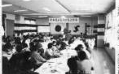
青年部幹事会開催の様子

王座就任を得て参事した部長九十二人、当初予想していた人員を遥かに超える状況に準備委員一同喜びを分かち合うと共に、新生の青年部に寄せる期待感の大きさに身の引きまじる思いがしたものです。 総会席上、副部長の重責を押しつかるに至ってその思いは一言一語、参事の部員各位の期待に心懸った次第でした。 当市は紀伊半島南端に位置し、豊富な水産・山林資源を基盤とした水産業・林業業を中心に発展してきた地方小都市ですが、近年基礎産業の低迷、商工業の停滞傾向にあって、地域の新たな製錬、活性化が欠かぬ課題とされてきています。