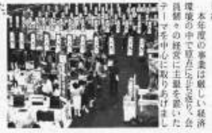
若国指定名勝 社内での記念式典

数字の読める経営者づくりが目標です。 また最近、婦人の方も青年部に加わり活動しています。女性ならではの意見が聞けていいと大受好評です。一人でも多く加入していただき、青年部が本気で期待される組織として成長していくためには、全員一致協力し、運営に参加していかねばならないと思つています。 親会議内にはもちろん、行政・経済団体・各団体とも連携をとり、具体的活動へと展開を促さなければならぬと、商青連へも加入した次第です。 全国の皆様の幅広い友情を通じて、研鑽をますます深めていきたいと思つたので、よろしくご指導いただき、ますますお熱いお申し込み、入会のご機運にかえたいと思つています。 見い出された、さらに、全国大会が福島の開催されることもたはずとなりました。 設立準備委員会を設置し、本市青年部へも熱意のため足場を築き、設立までには十分な時間をかけ、筑井川らに持つた青年部づくりを目標として、本年五月二十四日に百八人の会員で、親会議をならびに筑井川市民に招き入れてスタートしました。 今、筑井川地方では、昭和六十八年開港へ向けて福島空港の大型プロジェクトの展開、商業近代化へ向けたい実施計画の策定など、活気づけたい大きな転機期に直直している。 会員各自が常に街づくりと自らの企業を行きまわしつつ、商工会議所の事業を認識し、青年としての夢と希望を託すし、アクションとして筑井川の未来へ向け、後継も二枚も買って行きたいと思つている