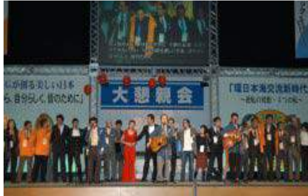
最後は小田原バンドと会場が一体となり、 友情を深めた

全国から来られた YEG 会員の皆様に、 鳥取県の良さを ここならではの食 と ここならではのおもてなし を通して、 「また来てみたい」と思って頂ける 満足ある懇親会を目指しました。