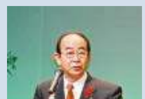
米子市長 野坂 康夫