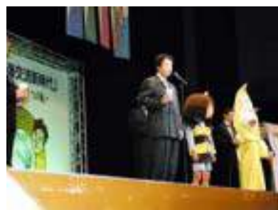
古泉相談役による、乾杯