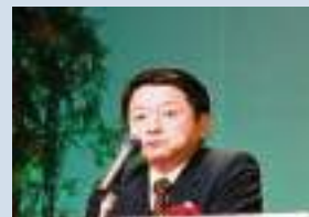
鳥取県知事 片山 善博