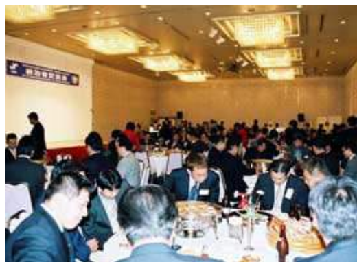
テーブルいっぱいになべられた海の幸