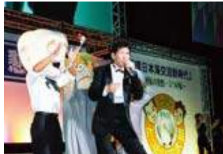
足立実行委員長 この歌は本当にこれで最後です(?)