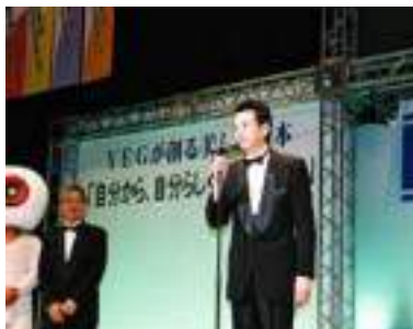
感動で少々緊張ぎみの荒濱大会会長