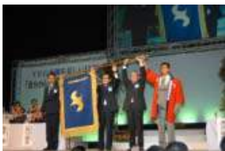
大会旗は帯広 YEG の手に