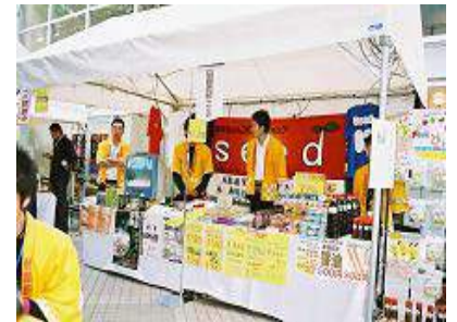
鳥取商業 高校生が運営する楽しいお店