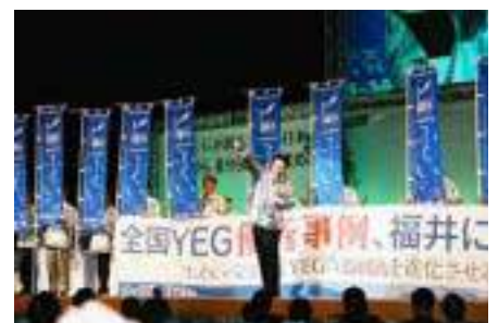
第21回全国会長研修会ふくい会議 PR