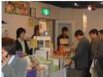
妖怪舎 さすが鬼太郎グッズ、 爆発的な売れ行き