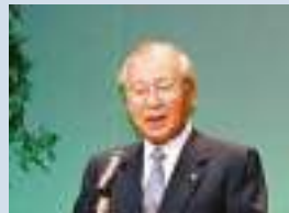
日本商工会議所 会頭 山口 信夫