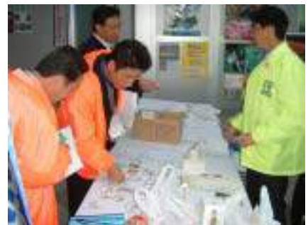
ビジネス交流プラザ景品交換 鬼太郎ファミリーのピンズが意外と大人気