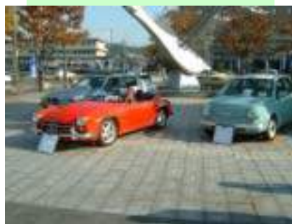
(株)車輪庫 今年も契約できたとか？