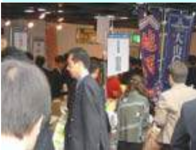
米子ええもん会 地元の物産に興味津々