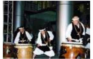
迫力ある僧兵太鼓で歓迎