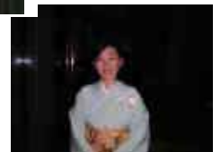
会場で見かけた 着物美人