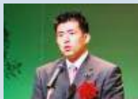
参議院議員 田村 耕太郎