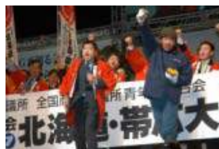
北の国から熱き思いを運んでくれました。