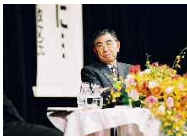
(株)イトーヨーカ堂代表取締役会長最高経営責任者 鈴木 敏文氏

東海ブロック大会の主管は、松阪 Y E G 創立以来最大の事業となりました。メンバーには大会終了まで大きな労力と時間を費やしてもらいました。事業を進めていく過程では、様々な問題、障害も発生しましたが、大きな事業を無事やり終えることが出来、メンバー一人ひとりが大きな達成感と満足感を感じてくれたと思います。ブロック大会の成功はメンバーの一人ひとりが、自分で考え行動できた結果だと思えます。この経験は、今後の松阪 Y E G の事業のみならず、メンバーの事業にも必ず役立つものと信じます。ブロック大会の主管は、私にとっても、メンバーにとっても最高の経験でした。ブロック内はもとより全国の Y E G メンバーとの出会から多くの感動をいただきました、本当にありがとうございました。