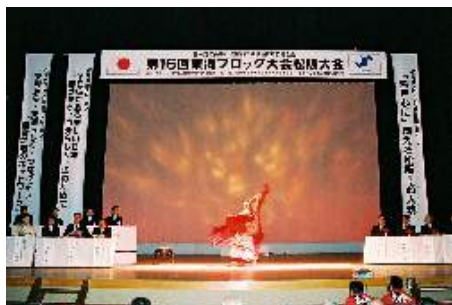
記念式典は歓迎のフラメンコで始まった。

式典から懇親会まですべて全力を尽くし成功した！と言いたいところですが、強いてあげるならば、屋外で行なった大懇親会です。約 250 個の七輪と約 400 キロの牛肉を用意して参加者全員に肉を焼いてもらいました。またアトラクションにサンバを取り入れ参加者全員でサンバのリズムで盛り上がりました。