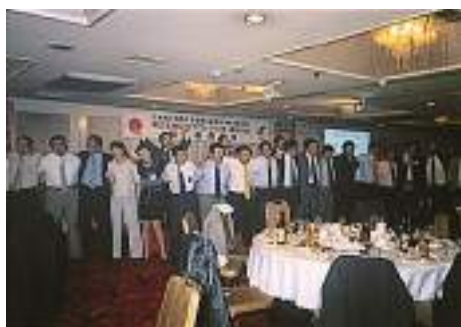
おいおいに盛り上がった前泊者懇親会

本当に多くのメンバーと商青連・県外メンバーにお越しいただき、感無量の2日間でした。天候にも恵まれ、気持ちの良い時間をみんなと過ごせたのが、何よりでした。ほぼスケジュール通りに進んだのも、参加いただいたメンバーの協力のお陰と感謝します。残念だったのが、館林を空からご覧頂こうと思って企画した、熱気球が風の為、中止になった事でした。この一年半、メンバーは大変だったと思いますが、勉強になり、より絆が深まったようです。来年の上尾(埼玉県)へも多くのメンバーの参加をよろしく願います。「ありがとうございました。」