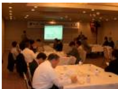
真剣に取り組むビジネス交流会

北見商工会議所青年部 TEL 0157-23-4111 FAX 0157-22-2282