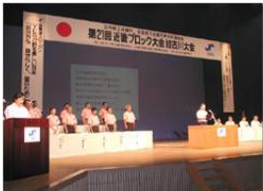
心地よい緊張感に包まれる記念式典