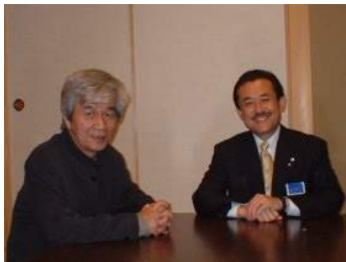
ジャーナリスト 筑紫 哲也 氏

1951年、岡山県生まれ。東大法学部を卒業後、自治省(現総務省)へ入省。大臣秘書官、鳥取県総務部長などを経て、 99年4月、同県知事に。現在2期目。政治家らの「ロリキ」内容の文書化を制度化するなど、徹底した情報公開を進めている。 現在、行政はもちろん、あらゆる分野から、最も注目されている県知事である。