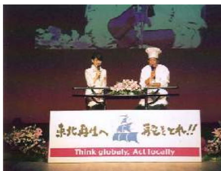
中華の鉄人 陳 建一氏

三年がかりにて準備をおこなってまいりましたが、参加頂いた青年部メンバーの皆様へ十分に気仙沼の魅力を伝えることが出来たのではないかなと思っております。皆様のご支援ご協力、誠にありがとうございました。