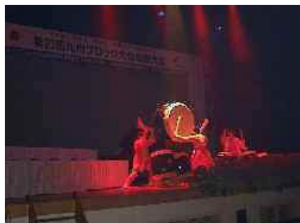
力のこもった太鼓の生演奏