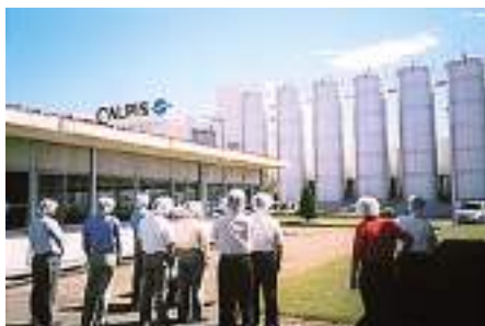
分科会では地元工場見学も。 説明に一心に耳を傾けるメンバーたち

すべてに満足していますが、記念式典が時間通りに終わられたことにはホッとしています。