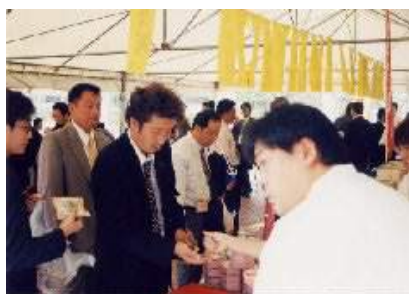
大盛況の大物産展