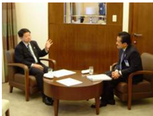
鳥取県知事 片山 善博 氏

大学在学中に日本に留学、卒業後再び日本を訪れ、長野県で就職。1994年に(株)榊一市村酒造場に入社。 97年に同社の再構築に取り組み、翌年取締役に就任。国際北斎会議を小布施での開催「桶仕込み酒」の復活、 「小布施シヨンの開催など、さまざまな文化事業を手がけ、成功に導いている。