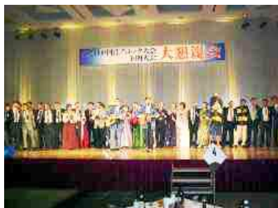
皆ひとつの輪になって大合唱