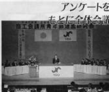
アンケートを もとに全体会議

去る10月6日、アロウ平成5年度北海道ブロック運営研究会が恵庭市で開催されました。 第1日目は、夜明の中、記念交遊ゴルフコンペとスキースキトン及び動物看護交流が開催され、親交の輪を結びました。第2日も晴天の中、専攻の第1回大会を兼ね、道内3青年部3日連続、道外からも10青年部13名、合計で予想を上回る230名の参加をいたしました。