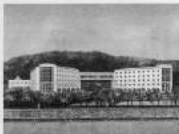
商工会議所福祉研修センター