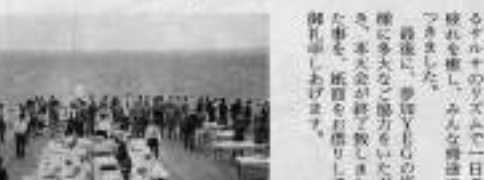
研究会はランナーチェンによるマラソンで一日の疲れを癒し、みんな笑顔になりました。

了いたしました。 議題は、スキースキトンとして一般市民も交えたON五日スキー大会を行いました。また、後述の通り、アンケートが十分に集まりました。この結果、今後の運営研究会の開催が決定いたしました。 本大会は、北海道、東北、関東、中部、関西、九州、沖縄の9ブロックの青年部代表が参加する全国大会を開催いたします。