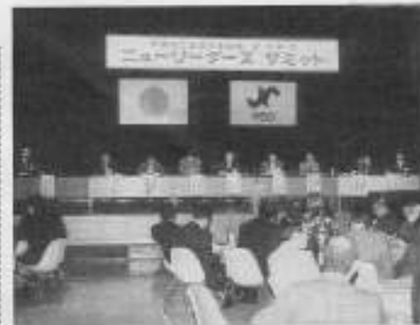
会議所とともに、ニューリーダーズサミット 新しい人材育成を目指す

飛行機の父・二宮忠八の生誕地、愛知県、八幡浜市。一帯は、九州との関わりが深い。大船クレーンが活躍している。四国一の規模を持つ造船工場も知られる。一帯は、二宮忠八の功績を顕彰する中心の地域でもある。