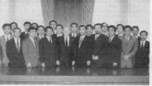
〔出席者名簿〕 (敬称略・順不同)