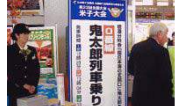
3班に分かれて JR 米子駅「0 番線」ホームから境港分科会会場へ