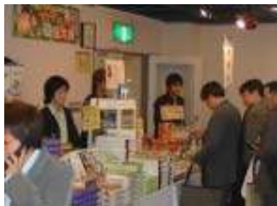
妖怪舎 さすが鬼太郎グッズ、 爆発的な売れ行き