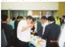
大盛況だったカニの食い放題。

海沿いにそびえ立つタワーでの自由行動。世界最大規模の立体映像システムで環日本海交流時代の勉強をするもよし、温泉から海を展望するもよし。