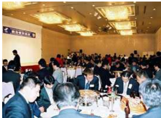
テーブルいっぱいになべられた海の幸