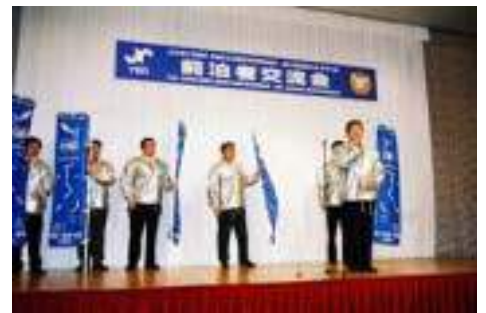
第21回全国会長研修会 ふくい会議のPR が元気いっぱいに練り広げられる