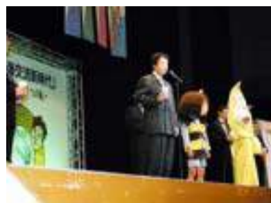
古泉相談役による、乾杯