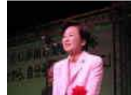
女優の司葉子さん も駆けつけて下さ いました。