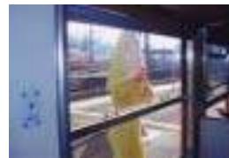
ねずみ男がお出迎え

全長わずか 17.9km、単線。自動車社会の昨今は存在感の薄い路線であった。しかし、車体に鬼太郎のペイントをした事で、話題の路線へ好転した。鬼太郎列車に乗車した瞬間から物語は始まります。