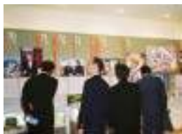
妖怪について、かなり 詳しくなったかも

2003年3月にOPENの記念館。ゲゲの鬼太郎というブランドを生み出した水木しげる氏の哲学・創造力や、世界各地から集められた妖怪に関する珍しい品々には、参加者の発想が好転する鍵が隠されています。