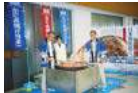
「皆よく食べてくれたなあ」 カニの試食会にて

日本海時代を展望した対岸貿易の海の玄関口として、国際的な水産・貿易都市として注目を集めている境港市。国際都市へ期待が集まる一方、ノスタルジックな街づくりで全国から多くの観光客を集めています。マイナスのイメージの強い「妖怪」を前面に出す逆転の発想により、寂れた商店街に活気が戻り、全国から新しい顧客を集めるようになりました。参加者には、実際に官民一体となった観光ルートを回っていただき、発想の転換から新しい価値を見出す商品づくりを学んでいただくと同時に、妖怪との出会いで心を癒し、楽しく交流していただきました。