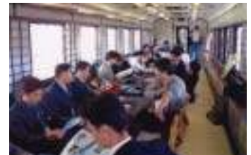
貸切り列車にはお座敷タイプも