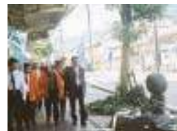
歩道のあちらこちらで 妖怪たちと目が合う

駅を降りると、妖怪達の町です。駅前商店街が妖怪の登場で転生、生まれ変わりました。800mの通りに83体の妖怪達がずらりと並び、少し寂れた風景も妖怪と不思議なハーモニーで活かされています。