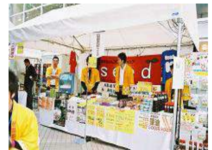
鳥取商業 高校生が運営する楽しいお店