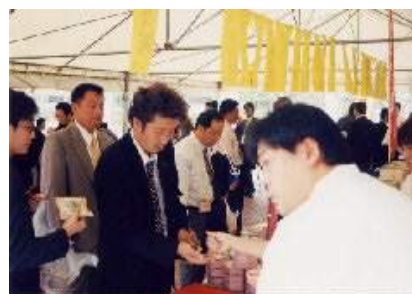
大盛況の大物産展