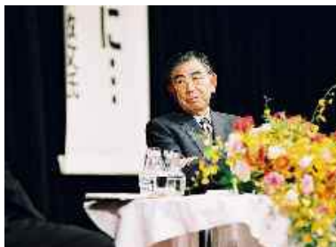
(株)イトーヨーカ堂代表取締役会長最高経営責任者 鈴木 敏文氏

東海ブロック大会の主管は、松阪 Y E G 創立以来最大の事業となりました。メンバーには大会終了まで大きな労力と時間を費やしてもらいました。事業を進めていく過程では、様々な問題、障害も発生しましたが、大きな事業を無事やり終えることが出来、メンバー一人ひとりが大きな達成感と満足感を感じてくれたと思います。ブロック大会の成功はメンバーの一人ひとりが、自分で考え行動できた結果だと思えます。この経験は、今後の松阪 Y E G の事業のみならず、メンバーの事業にも必ず役立つものと信じます。ブロック大会の主管は、私にとっても、メンバーにとっても最高の経験でした。ブロック内はもとより全国の Y E G メンバーとの出会から多くの感動をいただきました、本当にありがとうございました。