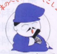
イメージキャラクター「ただてる君」 諏訪の文化の基礎を築いた 徳川家康公六男「松平忠輝」