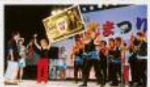
▲銭形踊りコンテストの様子

観音寺市では毎年夏の大イベントとして「銭形まつり」を開催しています。このお祭りには、観音寺市のシンボルである銭形の砂絵にちなみ「銭形の青」さんおんこを広く全国に紹介するとともに、観光客の誘致を図り、産業・文化の発展に寄与することを目的として観音寺商工会議所が発起人となって実施しており、今年で37回目を迎えようとしています。