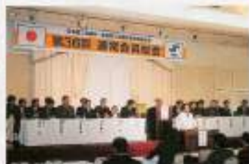
▲実行委員会委員の様子