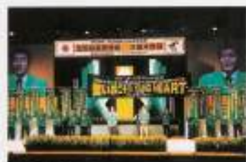
▲久留米商工会議所の様子

最後になりましたが、全国会長研修会久留米会議の開催にご理解を頂いた貴単会の皆様、さらに多大な御支援をいただいた皆様ならびに関係各位に心より御礼申し上げます。ありがとうございました。