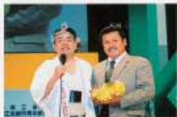
▲プレゼンテーションの様子