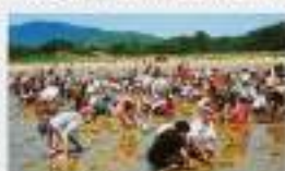
▲銭形まつりの様子

祭り」を各言葉に新しい「銭形まつり」が出来上がっていききました。 そして、第31回から商店街会場での「おどろ」に加えて、銭形の砂絵のある岸野公園を舞台に、優勝賞金100万円の「銭形踊りコンテスト」、賞金総額100万円の電子型宝塚ゲーム「銭形大会」など、観音寺らしい参加型のイベントが誕生しました。おかげさまで昨年は約5万6千人の方にご来場いただきました。現在、我々YEGは「銭形踊りコンテスト」と「おどろ」を担当しています。今年も、来る7月20日(金)に開催することが決定しました。現在出場チームを募集しております。あなたの町からも、賞金目当てで参加してみませんか?