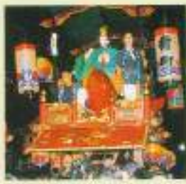
●村上大会の浮き舟(舟)の飾り。舟のなかには、お祭りを楽しむ人々がいる。