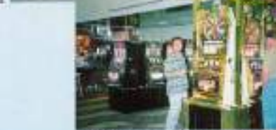
ラスベガス空港もカジノビレイク一帯も私です