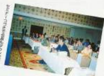
2004年7月14日 成田空港から成田