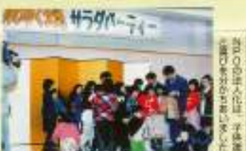
「西宮市」の西宮市人化、子供体験、西宮市での活動も盛り込みました。