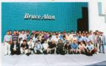
研修メンバー全員で

にかかると、ホテルに戻ったときには、もう既に半日ボロである。まるで耐久セミナーのようになってしまうが、まさに研修者にはいい。3月10日。今日は、朝の時から夜まで完全に2日間研修する期間がスケジュールである。まずは、北カリフォルニア日本産工会議所ホステス、スミエウツ氏のコーディネート