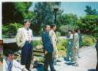
会席も存心と一景