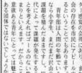
市民によるこぼれるF・F事業