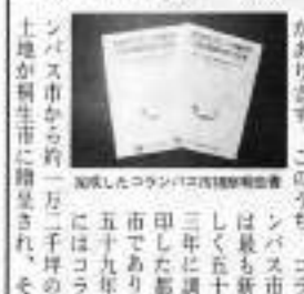
完成したコランバス市四姉妹都市宣言書