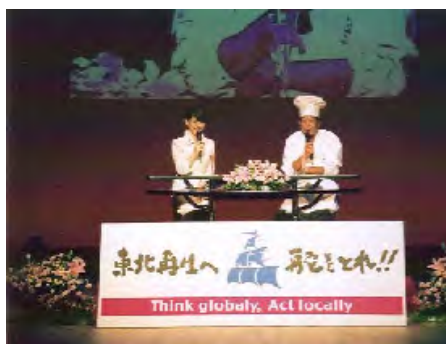
中華の鉄人 陳 建一氏

三年がかりにて準備をおこなってまいりましたが、参加頂いた青年部メンバーの皆様へ十分に気仙沼の魅力を伝えることが出来たのではないかなと思っております。皆様のご支援ご協力、誠にありがとうございました。